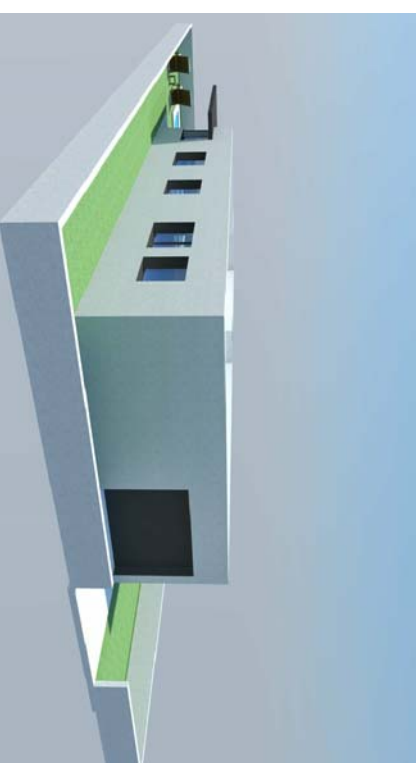
OPCIÓ COBERTA PLANA